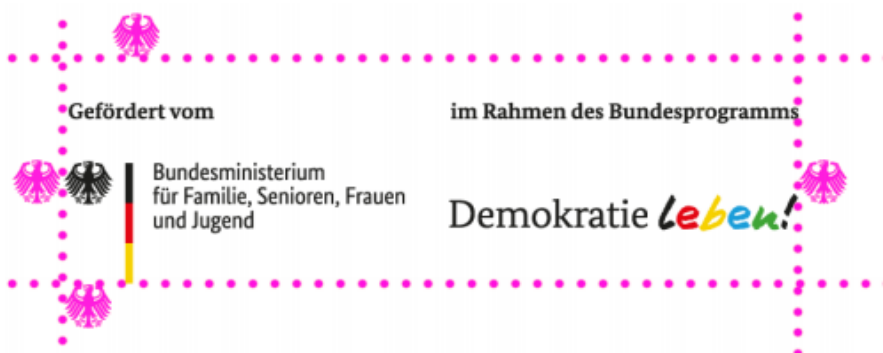
Abbildung 3: Schutzraum um das Förderlogo

Das Förderlogo ist immer auf weißem Grund zu stellen; die Größe muss so gewählt werden, dass es optisch zum Rest des Textes oder Bildes passt und ohne besondere Lesehilfe zu erkennen ist. Zu beachten ist weiterhin, dass das Logo vom BMFSFJ nach allen Seiten hin über eine Schutzzone verfügt, in der kein anderes Element platziert werden darf. Die Schutzzone hat zu jeder Seite hin die Breite von einem Adlerelement.